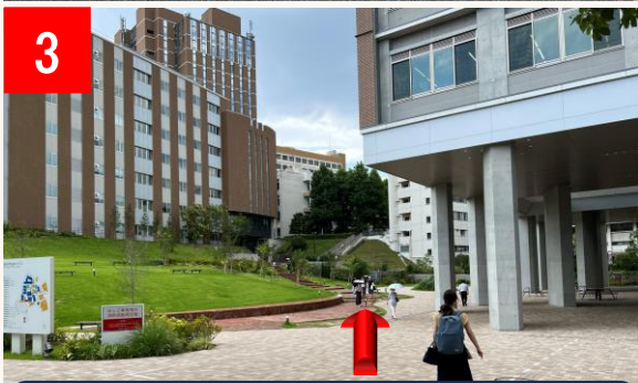
3 4 の通路まで直進します。