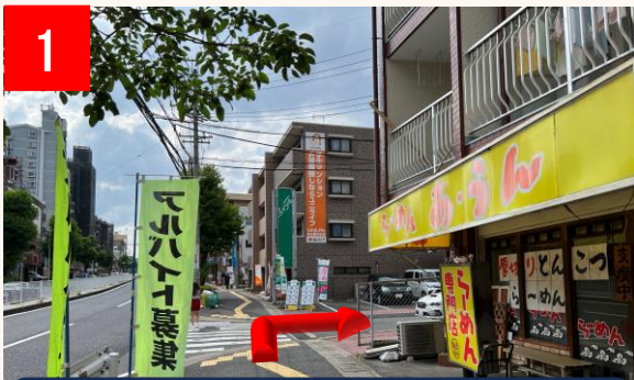
1 らーめん「あ・うん」を右折します。