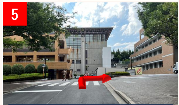
5 交差点を右折します。