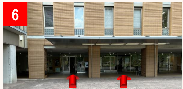
6 こちらが北館の入り口です。エスカレーターまたはエレベーターで4階までお越し下さい。

※塩釜口駅構内の案内図に従って、1番出口またはエレベーター出口からお越し下さい。