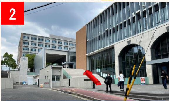
2 南門から入り、階段を上ります。