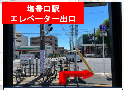
右折し、1 まで直進します。